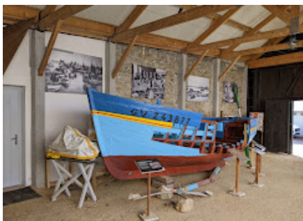
Écorché d'une barque

Une visite du musée d'un chantier de Lesconil en activité de 1905 à 1980 est programmée le jeudi 16 novembre à 15 heures.