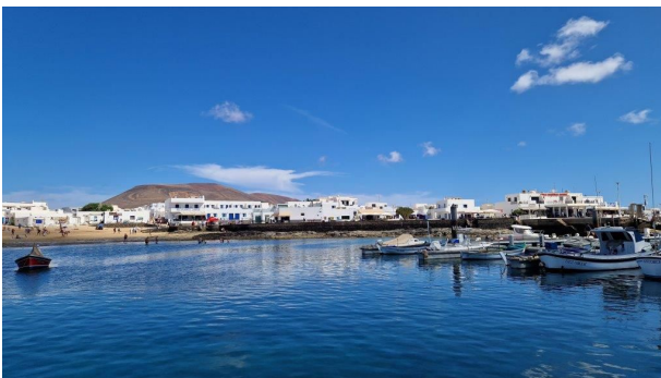
Escale à Graciosa