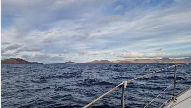
A l'approche de Graciosa

Nous avons quitté Mataiva et son équipage à Madère. Après 59 heures de mer, arrivée à Graciosa petite île des Canaries.