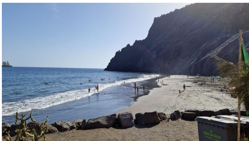
Ténérife et ses plages de sable noir