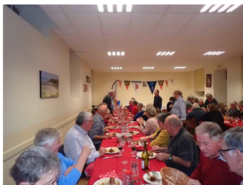
Le repas l'an dernier

Vendredi 24 novembre, nous organiserons notre soirée de fin de saison dans la salle des associations rue de Poulpeye à partir de 19h.