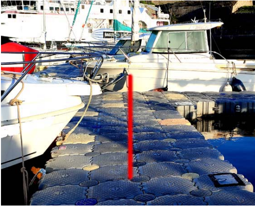
Rencontré à Belle Ile

De nombreux bateaux ne sont pas amarrés correctement aux pontons et catways. Ce bateau amarré au Palais qui empiète sur la moitié de ce ponton particulièrement glissant en est une parfaite illustration.