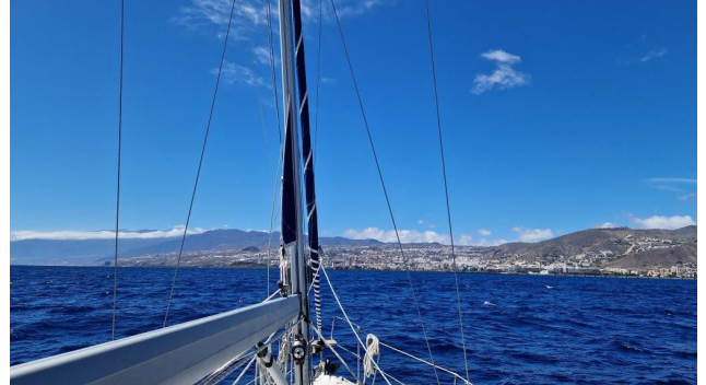
Mataiva arrive à Santa Cruz de Ténérife