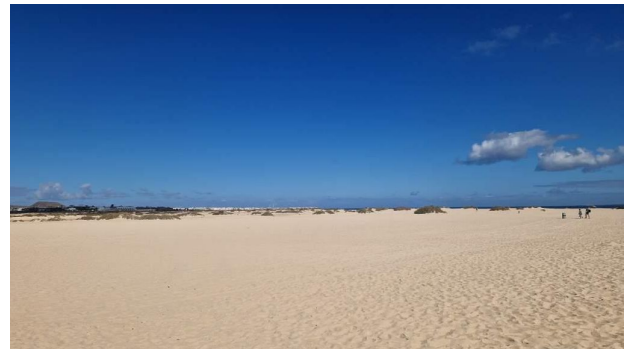
Les dunes du parc naturel de Corralejo