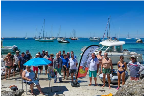
Les participants de l'an dernier

Nous nous retrouverons le lundi 21 août pour notre pique-nique à Penfret rivage est ou ouest en fonction du vent.