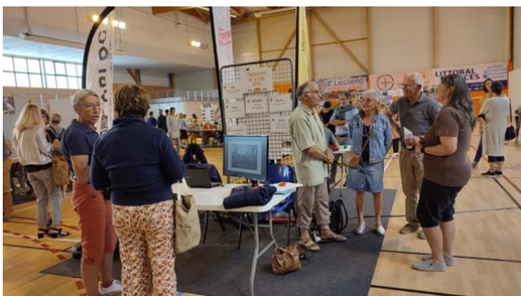
Le stand de l' APLOC

Comme chaque année l'APLOC sera présente au forum des associations qui se tiendra le samedi 2 septembre au complexe sportif de Kerandouret.