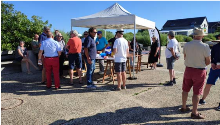
Le pot de l'an dernier

Comme chaque année, nous organisons un pot en août, l'occasion de rencontrer nos adhérents vacanciers et d'accueillir les nouveaux autour d'un verre que nous partageons avec les navigateurs en escale à Loctudy.