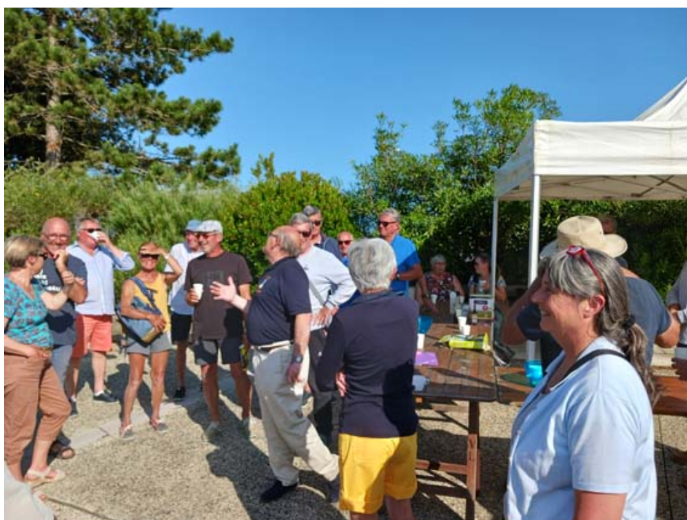
Affluence au pot de juillet

C'est sous un soleil radieux que notre pot de juillet a réuni une quarantaine d'adhérents. La météo ne fut pas aussi clémente pour le pique-nique le lundi suivant, les deux voiliers partis pour les Glénan ont fait demi-tour, un horizon bouché et une mauvaise houle ayant provoqué le mal de mer des passagers d'un des bateaux.