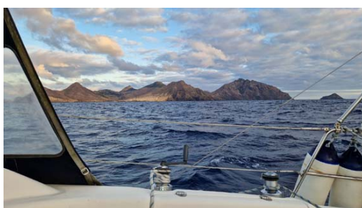
Terre en vue après 10 jours de mer