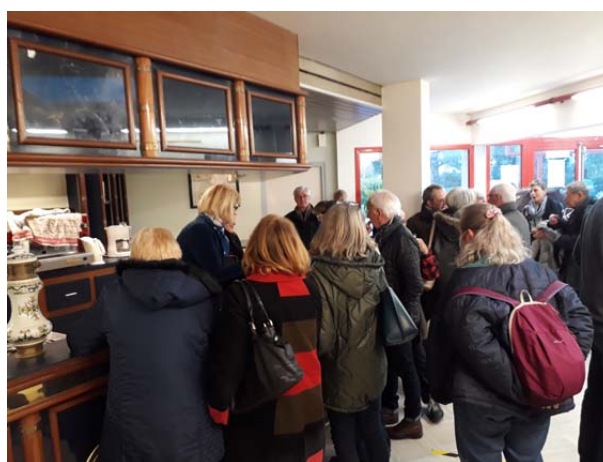
Un pot de l'amitié à l'issue de la conférence

Près d'une centaine de participants à la conférence des oubliés de Saint Paul attentifs à la présentation du film, ont échangé avec les intervenantes, descendantes d'un des survivants. Cette conférence s'est clôturée par un pot offert par la commune.