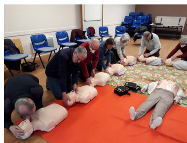
Contrôle de la respiration