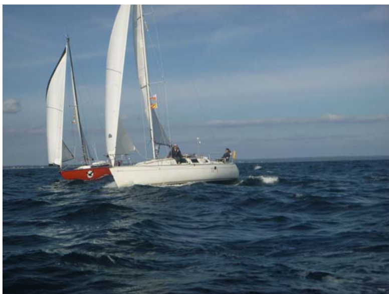
Bérenice et Lorca

Le trophée est un challenge dont la finalité est d'inciter les participants à optimiser les réglages de leur bateau. Il ne s'agit pas d'une régate ou d'une course en confrontation directe, mais d'un contre la montre individuel dont le temps de référence de chaque participant est établi par lui-même.