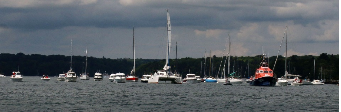
Margodig à la tête de l'imposante flottille sur l'Odet juin 2018