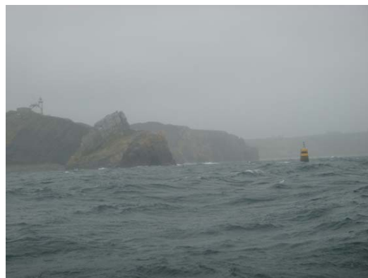
Le Toulinguet dans la brume