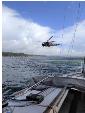
Rencontres insolites à la sortie du goulet de Brest