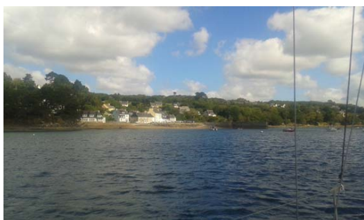
L'Auberlac'h (rade de Brest)