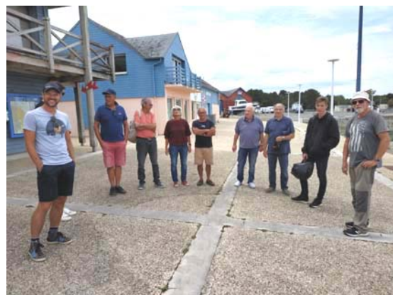
Une partie des participants

Le skipper est le seul maître à bord, libre d'accepter ou de refuser un équipier, il fait appliquer les mesures COVID.