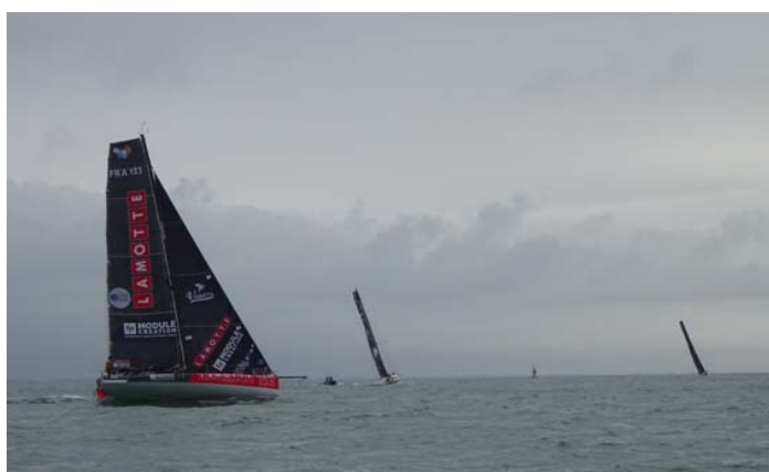
Au milieu d'une régates de classe 40, leurs derniers préparatifs avant la Jacques Vabre