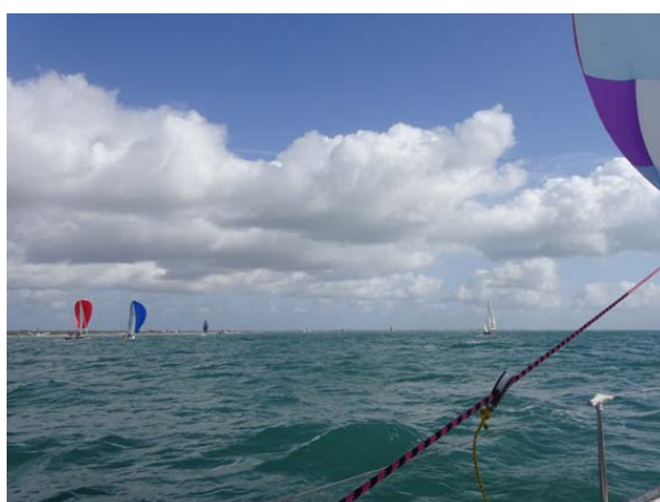
Arrivée à Lorient dans une régates de vieux gréements