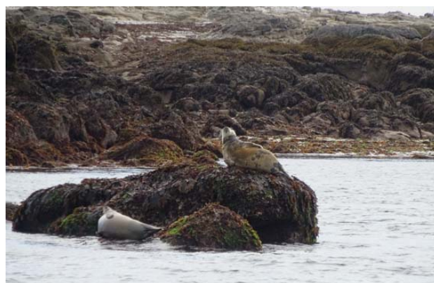
Les phoques sur l'île aux moutons