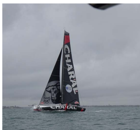
Et même Charal