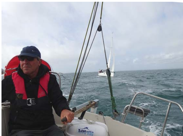
Un nouvel équipier concentré à la barre