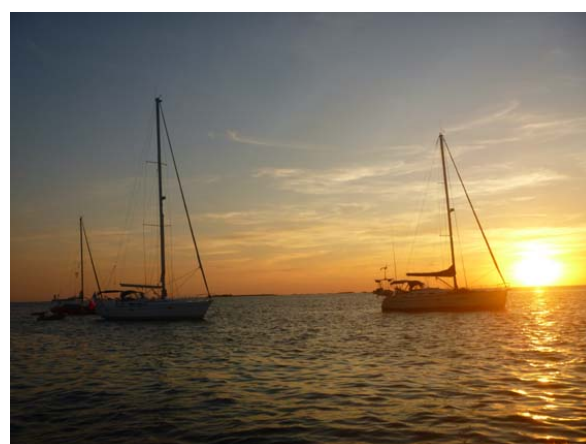
Coucher de soleil à Penfret