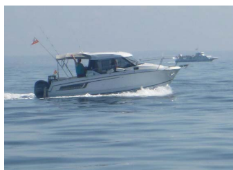
Belle météo pour les « moteurs »