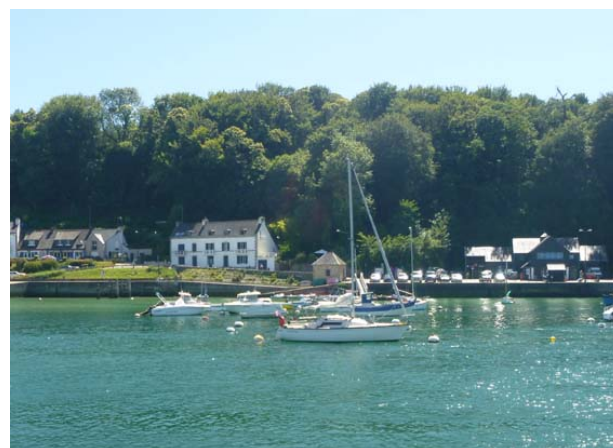
Mouillage au port de Bélon