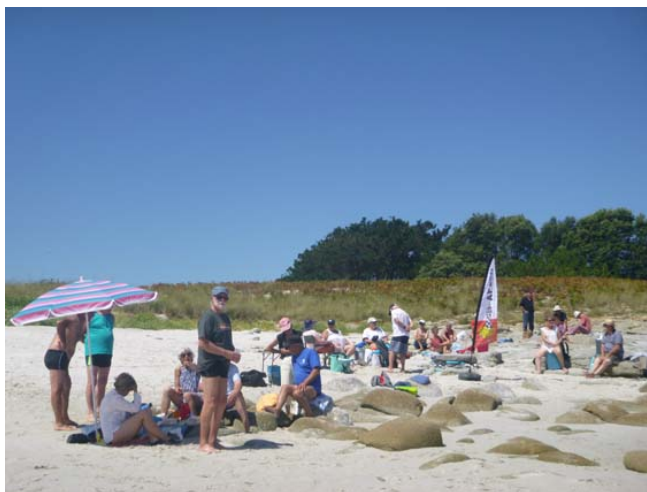
Une belle journée à Penfret