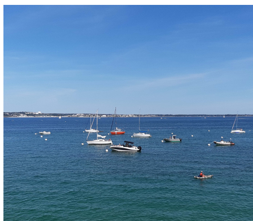
Mouillage au Cap Coz